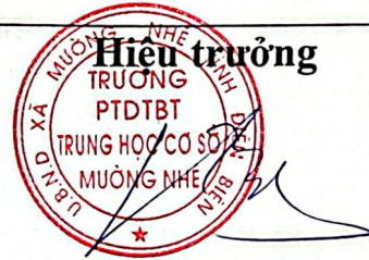
Dương Tiến Công